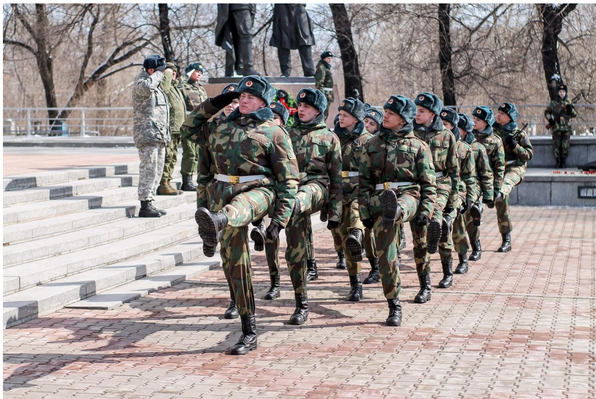
Дембельское фото «Ура! Ура! Урра-аааа!»