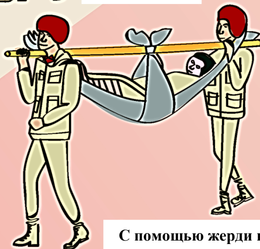
С помощью жерди и двух простыней